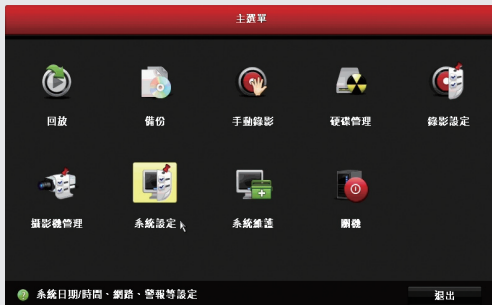
步驟1: 登入主選單後點選系統設定