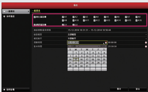
步驟1: 選擇要備份影像的頻道