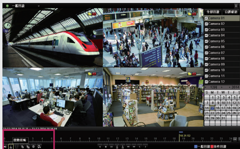
步驟1: 回放要開始備份的影像，點選開始剪輯、結束剪輯、最後保存剪輯