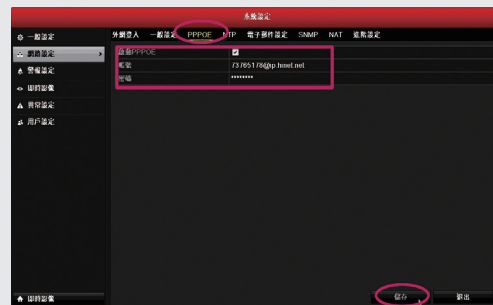
步驟4: 網路撥接，輸入電信業者所提供的撥接帳號及密碼（路由器撥接不需此設定）