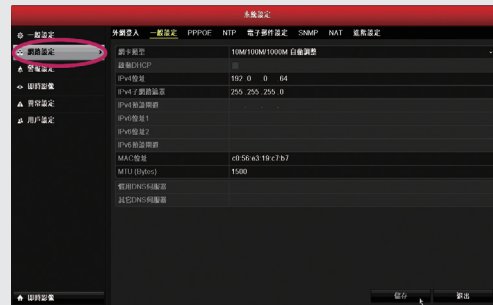
步驟2: 點選網路設定