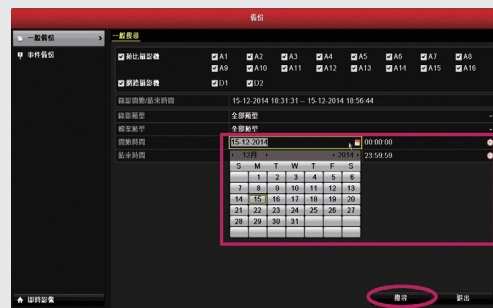
步驟2: 設定備份影像的開始與結束時間