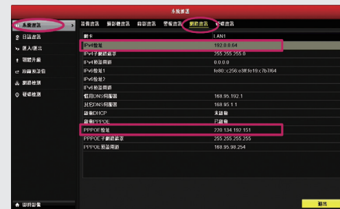
步驟5: 從系統維護中的系統資訊，可以取得連線狀況與連線的IP位址