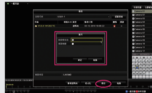
步驟3: 選擇備份影像檔案與撥放軟體，點選備份