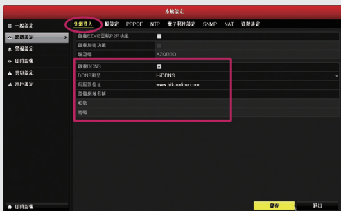
步驟3-2: 浮動IP設定，點選外網設定並啟動DDNS，輸入浮動IP的位址、帳號及密碼