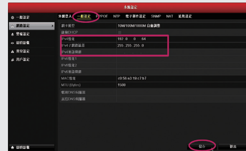
步驟3-1: 固定IP設定，請輸入IP位址、子網路遮罩、預設閘道