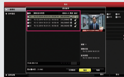
步驟3: 選擇影像檔案後開始備份